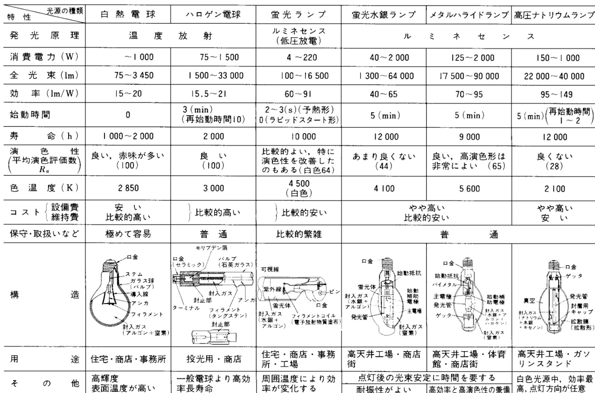
表 主な光源の性能と特徴