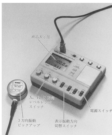
図 振動レベル計と振動ピックアップ